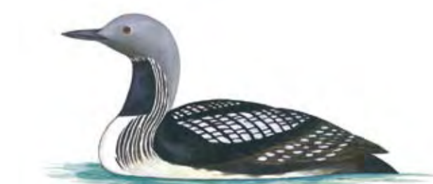
Du kan få se storlom i Härsjöarna. Dess rop ekar över sjön i sommarnatten.

Spelande orrar samlas i Härskogen. Alla vill de tävla om honornas gunst.